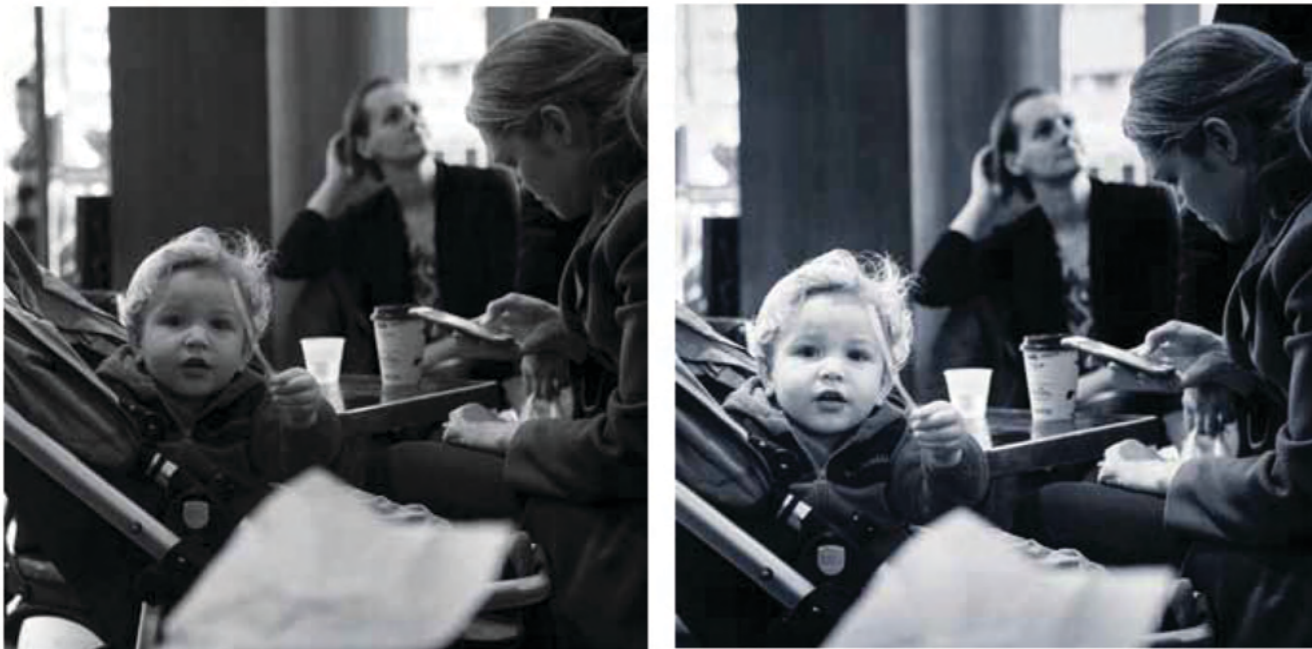
🔥 Vasemmalla on raakakuva, joka on vain muutettu mustavalkoiseksi. Oikeanpuoleinen kuva on viimeistelty. Siinä poika erottuu kuva-alalta selvemmin, tärkeimpänä pääkohteena.

hentää toisarvoisten kohtien huomioarvoa.