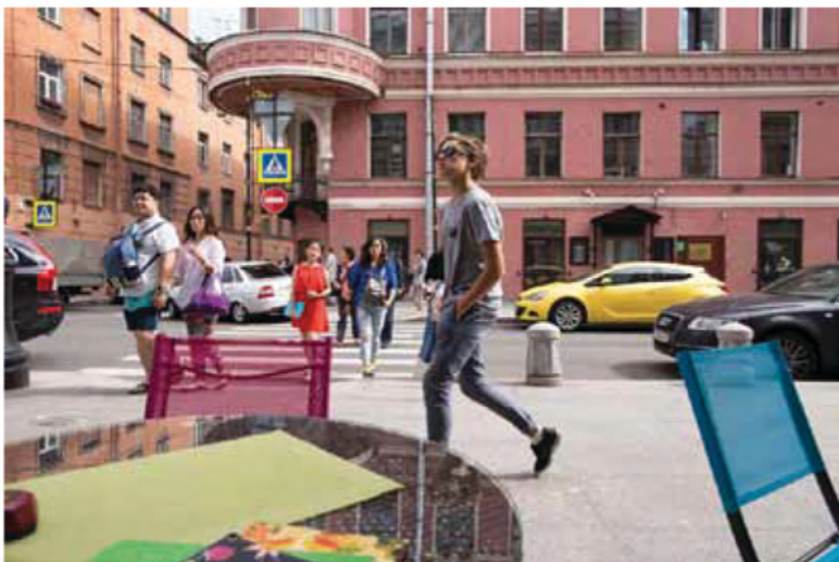
🔥 Alkuperäisen kuvan värit ovat mainiot, joten kuvan muuttaminen mustavalkoiseksi harmitti. Mutta koska kokonaisuuden oli tarkoitus olla yhtenäinen, ei yksi kuva voinut olla värillinen, saati eri mallinen.